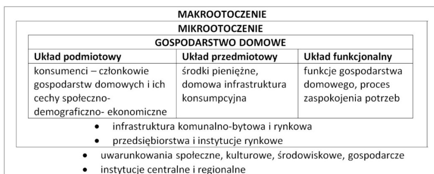
Rys. 2. Struktura gospodarstwa domowego i jego otoczenie